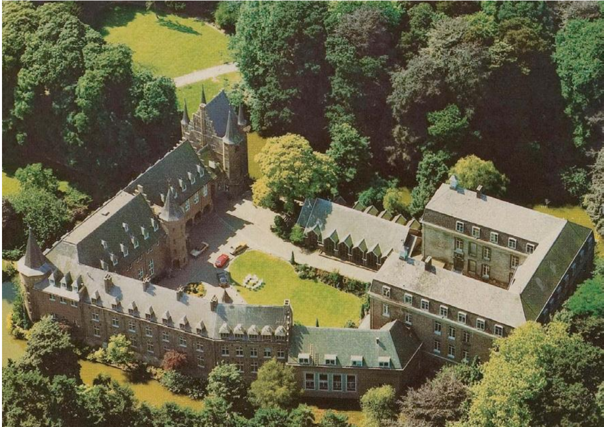
Het Kasteel Gemert-Bakel heeft een fundamentele rol in de regio

Hetzelfde geldt voor het Nazareth klooster, Gerarduskerk, lokale landschappen, waterpartijen, infrastructuur en verbindingen met de omliggende gebieden.