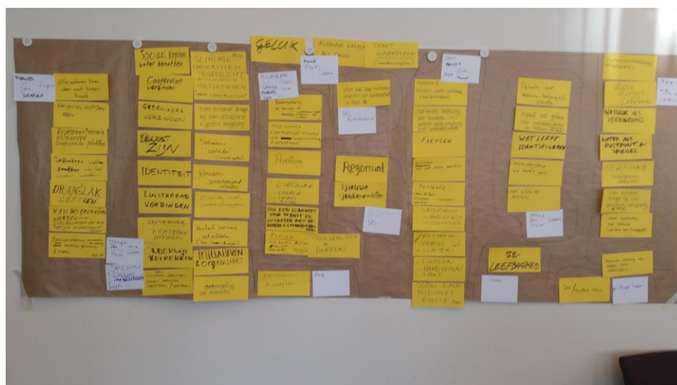
Dynamisch clusteren en prioriteit keuzes maken

De werkwijze is die van dynamisch multidisciplinair clusteren rond prioriteiten. Als voorbeeld noemen we de toepassing in Rijk van Dommel en Aa waar de traditionele overheid dossiers gekoppeld werden aan de Sustainocratische kernwaarde “gezondheid”. Hieruit ontstonden uiterst inspirerende discussies en gemeenschappelijk gedragen projecten.